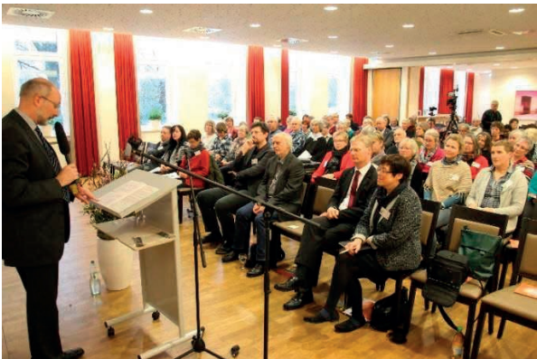
Beginn des 4. interdisziplinären Symposiums 2016 in Bocholt

Ab Anfang des Jahres wird es neben den im Heft verzeichneten Gottesdiensten weitere evangelische und katholische Gottesdienste zum Thema geben. Bitte achten Sie auf die Lokalpresse.